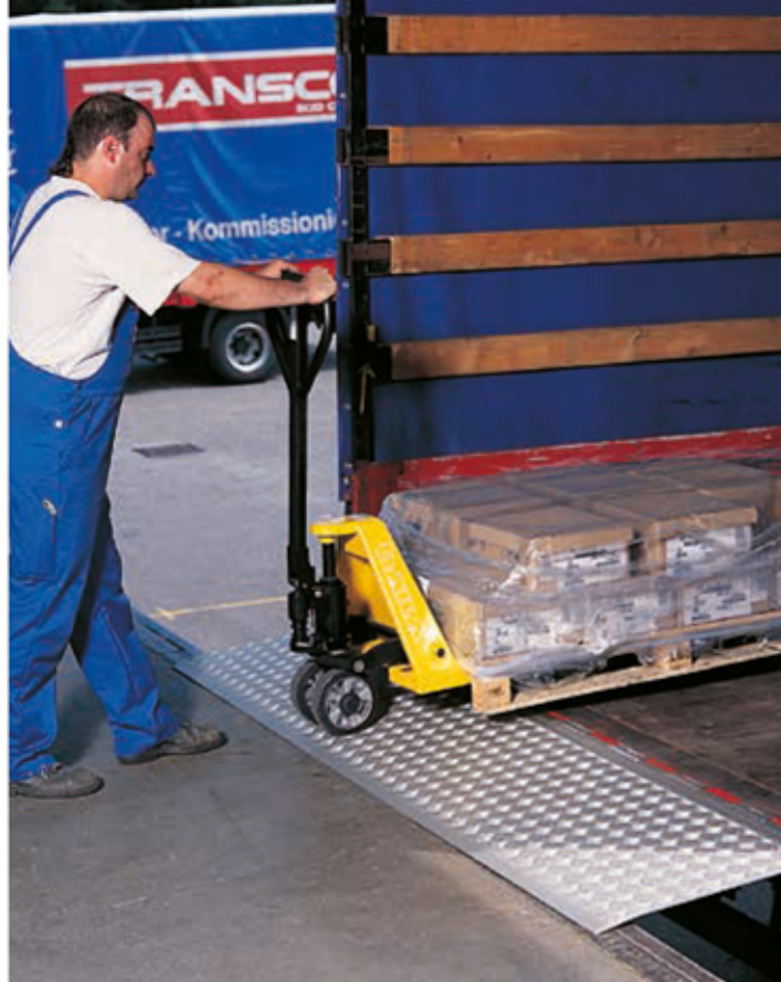
Ausführung 1 Aluminium Profilabschnitte zum Anschrauben