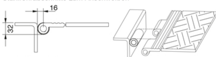
Ausführung 3 Durchgehendes Stahlteil zum Anschweißen/Anschrauben